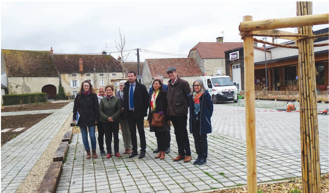
Les élus suivent les travaux.