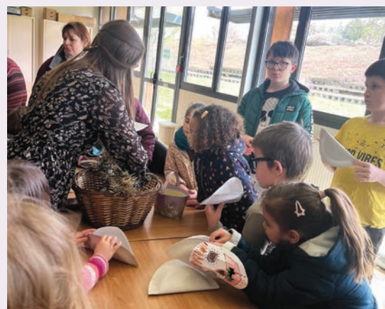
À la chasse aux œufs.

Une chaleureuse après-midi en famille pour la plaisir de tous !