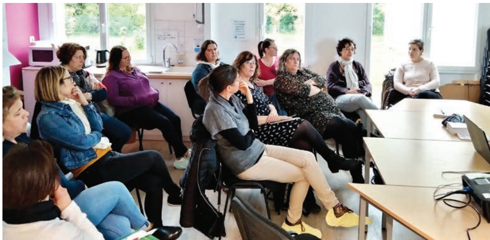
Une conférence passionnante.

Au programme : mise à jour des connaissances sur les dernières recommandations sanitaires, suivies d'échanges sur la diversification alimentaire pour l'enfant (DME) et les besoins nutritionnels de 6 mois à 3 ans. Les difficultés alimentaires (néophobie, troubles alimentaires pédiatriques...) ont également été abordées ainsi que des conseils pour varier