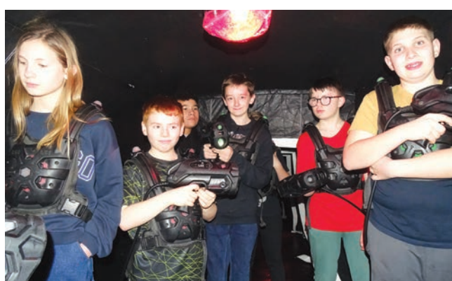
Fair-play et amusement au goût du jour.

Embuscades, infiltrations, et autres opérations stratégiques étaient proposées tout au long de la journée à l'intérieur d'une im-