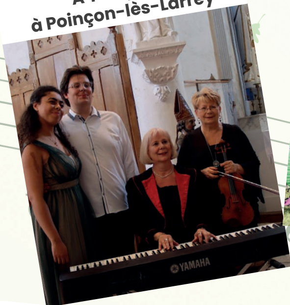
À Tempo 21 à Poinçon-lès-Larrey