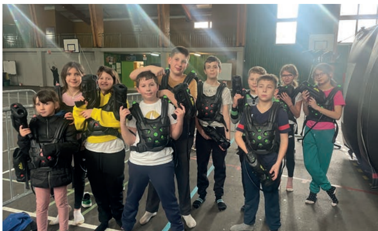
Beaucoup de jeunes...