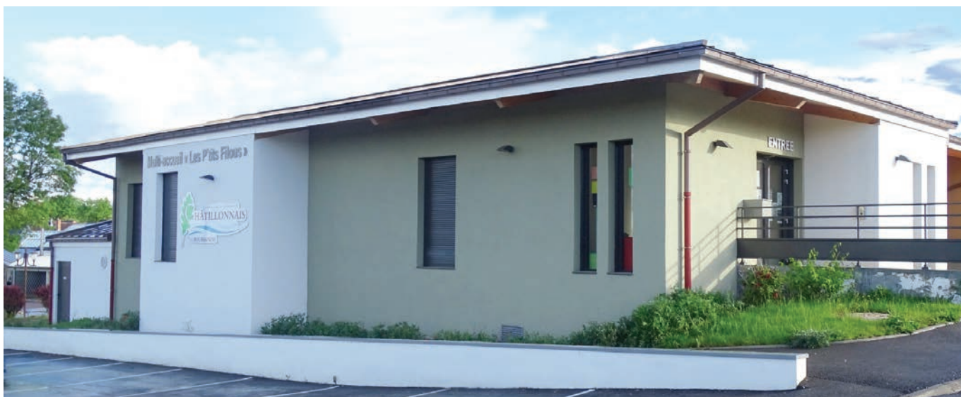
La crèche de Baigneux-les-Juifs.