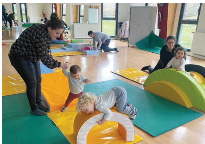
Différents ateliers étaient proposés.

Il existe en effet très peu de propositions d'activité s'adressant à des tout-petits.