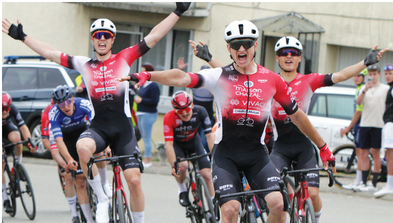
Triplé du SCO Dijon à Belan-sur-Ource.

La classique Troyes-Dijon, course cycliste emblématique du calendrier élite en France, est devenue la Classique du Châtillonnais. En 2024, la traditionnelle arrivée à la Toison d'Or à Dijon a donc laissé sa place au village de Belan-sur-Ource.