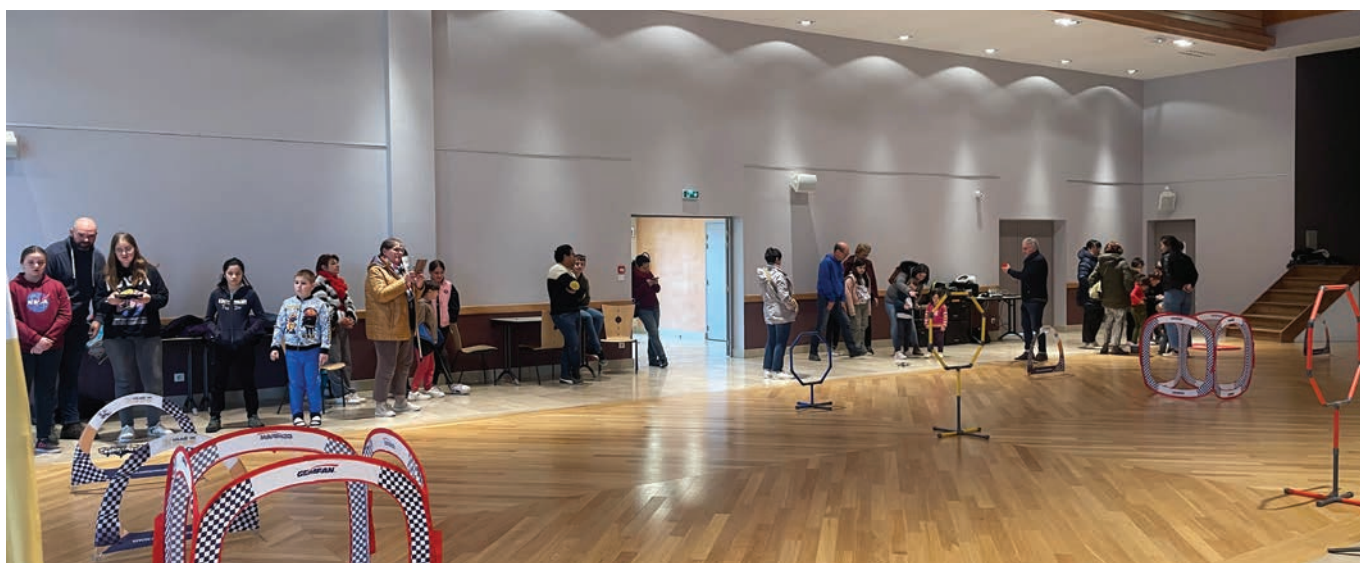
Différents ateliers étaient proposés à Vanvey.

Les dernières vacances de printemps avaient un goût de nouveauté pour les jeunes et leurs familles. Au programme de cette journée de vacances pas comme les autres, du pilotage de drones avec un intervenant aguerri de l'association « Imag'in drone ». Il aura fallu obtenir une multitude d'autorisations pour avoir le droit de faire voler ces drôles d'engins aux abords de la salle des fêtes de Vanvey investie pour l'occasion.