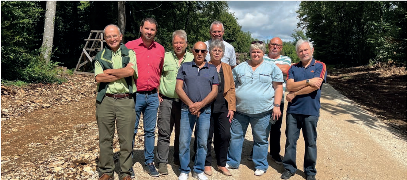
Visite du chantier.