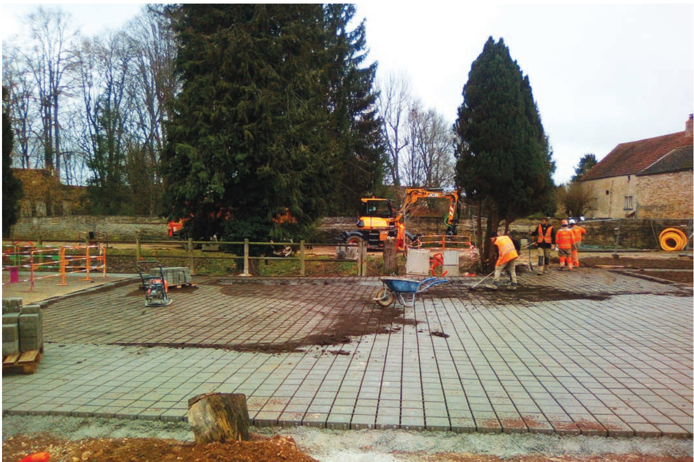
Un espace totalement nouveau.