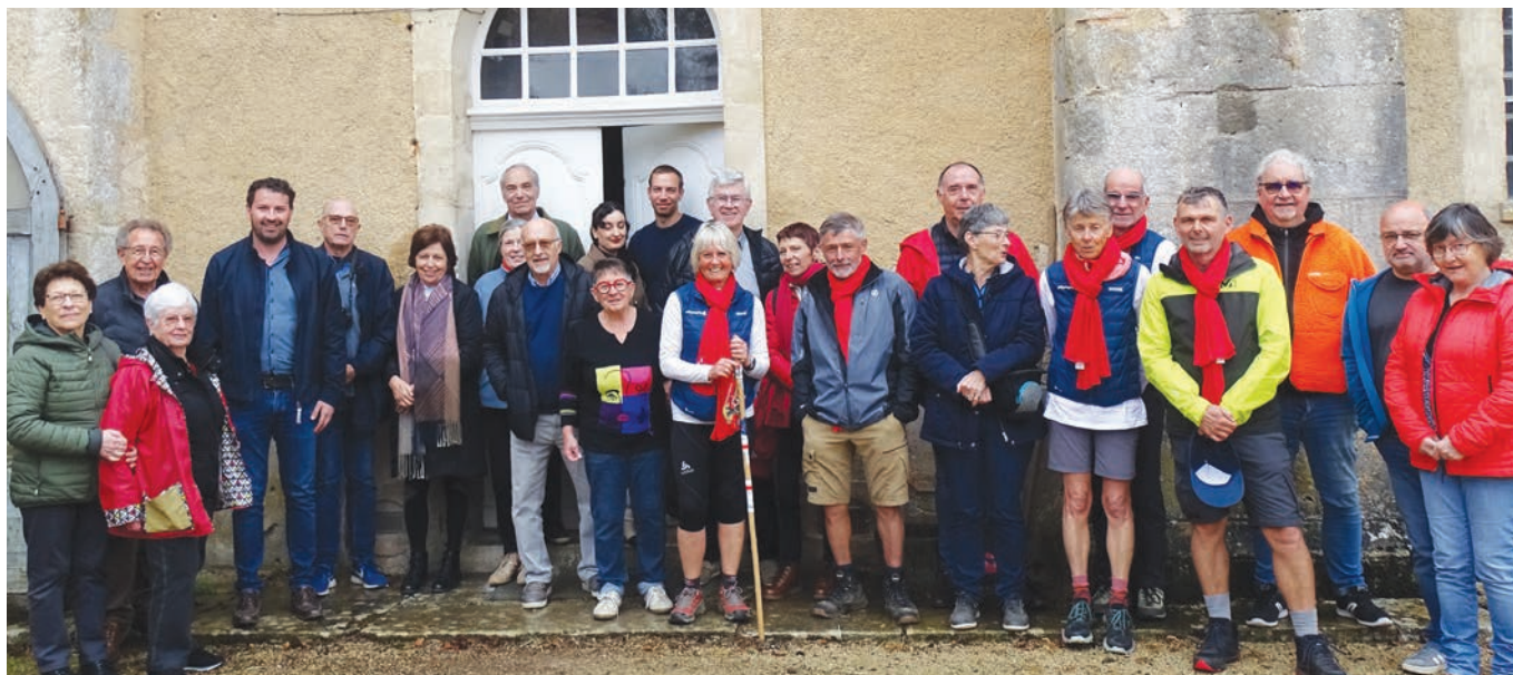
Arrivée à Oigny.

Pour être en phase avec les jeux olympiques, la Fédération française de Randonnée pédestre a initié sept grands itinéraires de randonnée convergeant vers Paris. L'itinéraire n°4 intitulé « Culture et œnologie », débutant à Mâcon, a rejoint le Châtillonnais par le GR2. Cinq ambassadeurs accompagnés par des randonneurs de clubs locaux ou de simples marcheurs ont traversé le territoire de Billy-les-Chanceaux à Mussy-sur-Seine, où ils ont passé le relais.