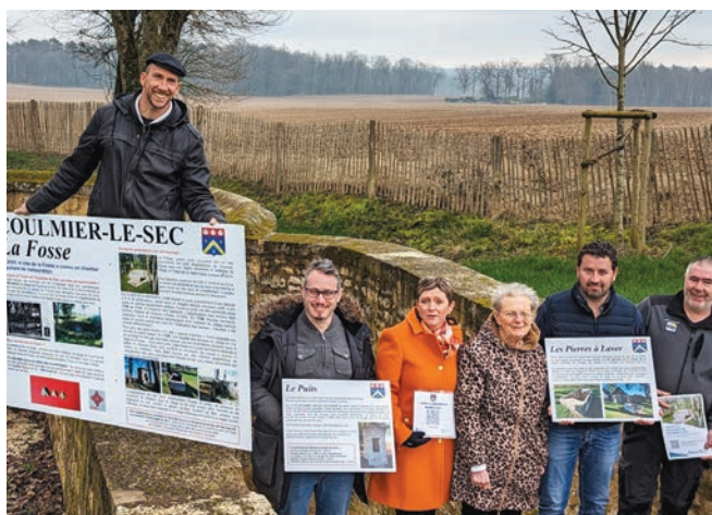
Un guide virtuel pour découvrir le village.

Ce guide est accessible en six langues et huit étapes de découvertes illustrées de photos vous sont commentées : l'église Saint-Germain au centre du village, trois calvaires témoins de l'histoire du village, des menhirs : pierres indicatrices d'une ancienne voie romaine de l'époque gallo-romaine, le monument dédié aux tirailleurs sénégalais et aux troupes d'outre-mer venus combattre avec la France en 1940, et point d'orgue de votre périple : la Fosse ; ce vaste ouvrage hydraulique du XVIII e siècle plein de mystères situé à 1,5 km du village. Une carte permet de visualiser le circuit et ces étapes sont accessibles en famille. Pour de plus amples rensei-