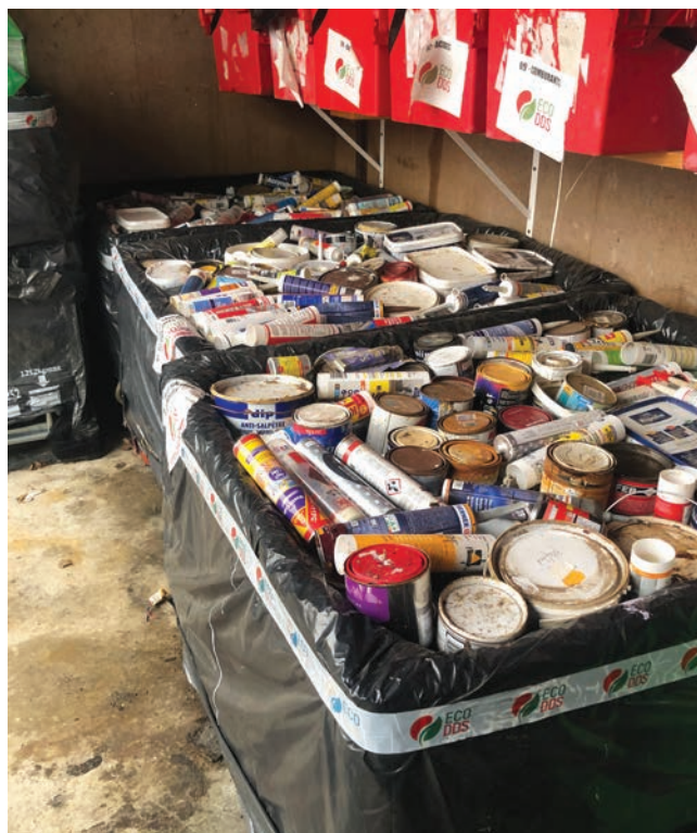
Stockage des produits chimiques en bacs repris par Eco DDS.

En triant correctement nos déchets électroniques et en les acheminant vers l'une des 7 déchèteries du Pays Châtillonnais, nous pouvons réduire la pression sur les ressources naturelles tout en minimisant les risques de pollution. De même, la collecte séparée des produits dangereux permet