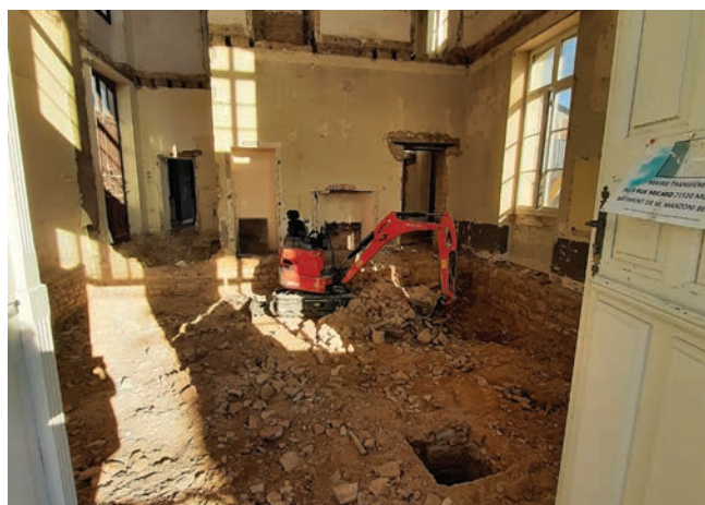
Des travaux de grande ampleur.

Ce bâtiment situé au centre du village a été construit dans les années 1880 afin d'accueillir une nouvelle école avec une mairie et un logement pour l'instituteur. À la fermeture de l'école en 1981, la salle de classe devient alors la salle polyvalente du village. Vieillissant, le bâtiment ne répond plus aux dernières normes en vigueur notamment en matière d'accessibilité pour les personnes à mobilité réduite mais également aux critères thermiques et électriques.