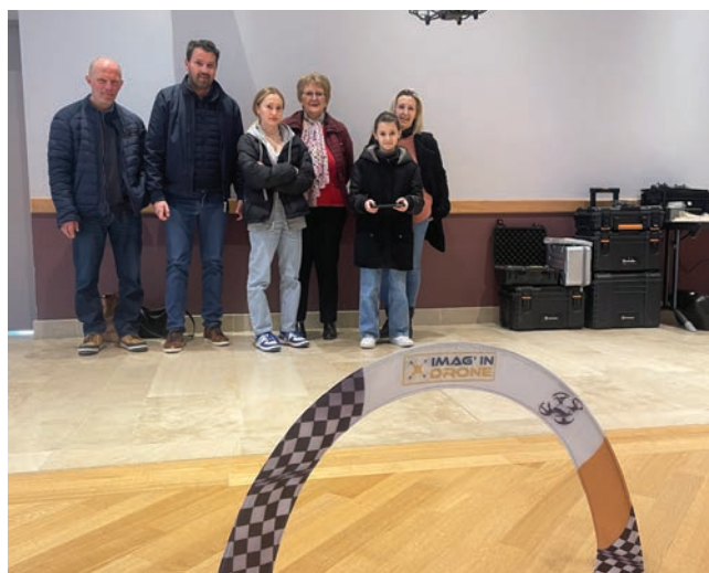
Une jeune fille très concentrée.