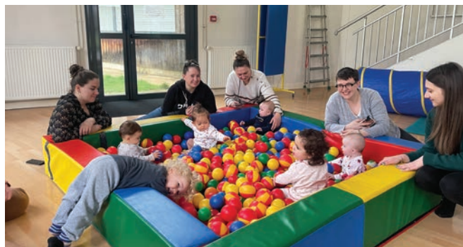
Une journée dédiée à la motricité.

Ce type d'atelier favorise la relation parent-enfant et permet aux familles de rencontrer d'autres familles.