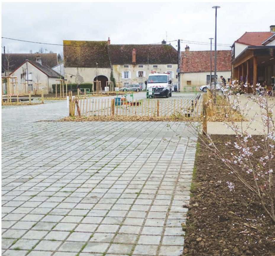
Place Saint-Martin à Leuglay.

Territoire en action , tout d'abord, contrat co-construit avec la région BFC autour du changement climatique (projets de renaturation) et des nouveaux services à la population, avec une enveloppe de 1,125 million d'euros.