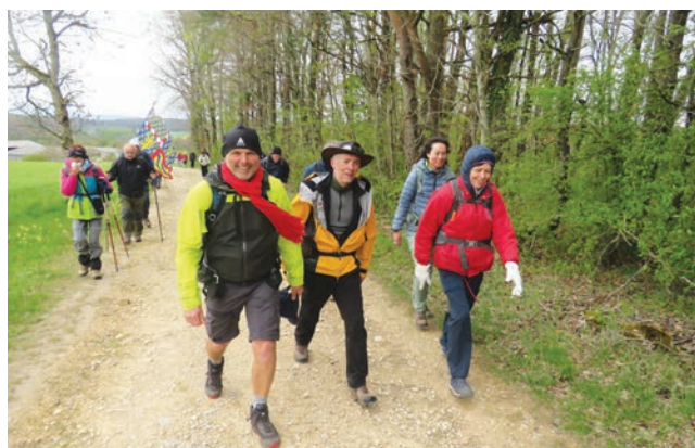
Sur le parcours.

Soixante-dix marcheurs ont fait une halte à l'abbaye d'Oigny où ils ont admiré les jardins et dégusté le « crémant du Châtillonnais ». Lors des différentes étapes, ils ont visité une ferme, le château de Duesme, « le Trou