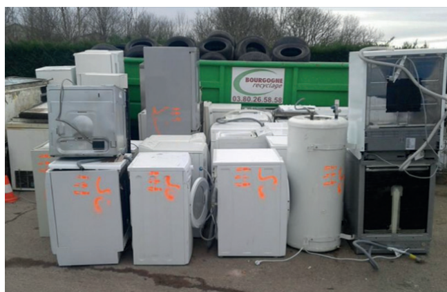
Dépôt des électroménagers hors d'usage repris par Ecosystem.

Pour connaître la liste des déchets ménagers spécifiques : https://www.ecodds.com/