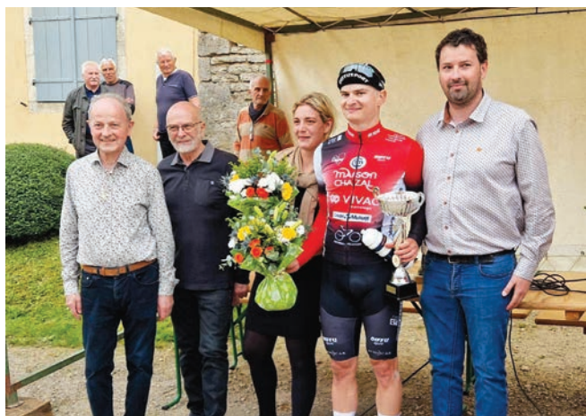
Remise des récompenses par les élus.

jamais pu se dérouler sans l'aide des bénévoles et l'appui logistique de la commune de Belan-sur-Ource. Rendez-vous l'an prochain pour une nouvelle course animée sur les routes du Châtillonnais.