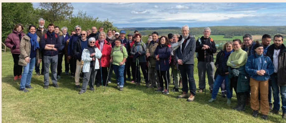
Agréable balade à Vix sur le Mont Lassois.

Les participants ont pu découvrir les paysages du Châtillonnais tout en profitant d'explications archéologiques sur le Mont Lassois durant l'Age du Fer, animées par les médiateurs du musée et l'application « Princesse de Vix ».