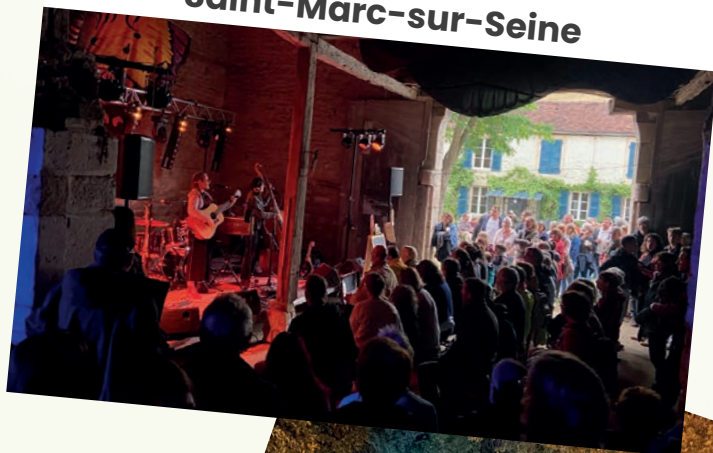
Festi'Val de Seine à Saint-Marc-sur-Seine