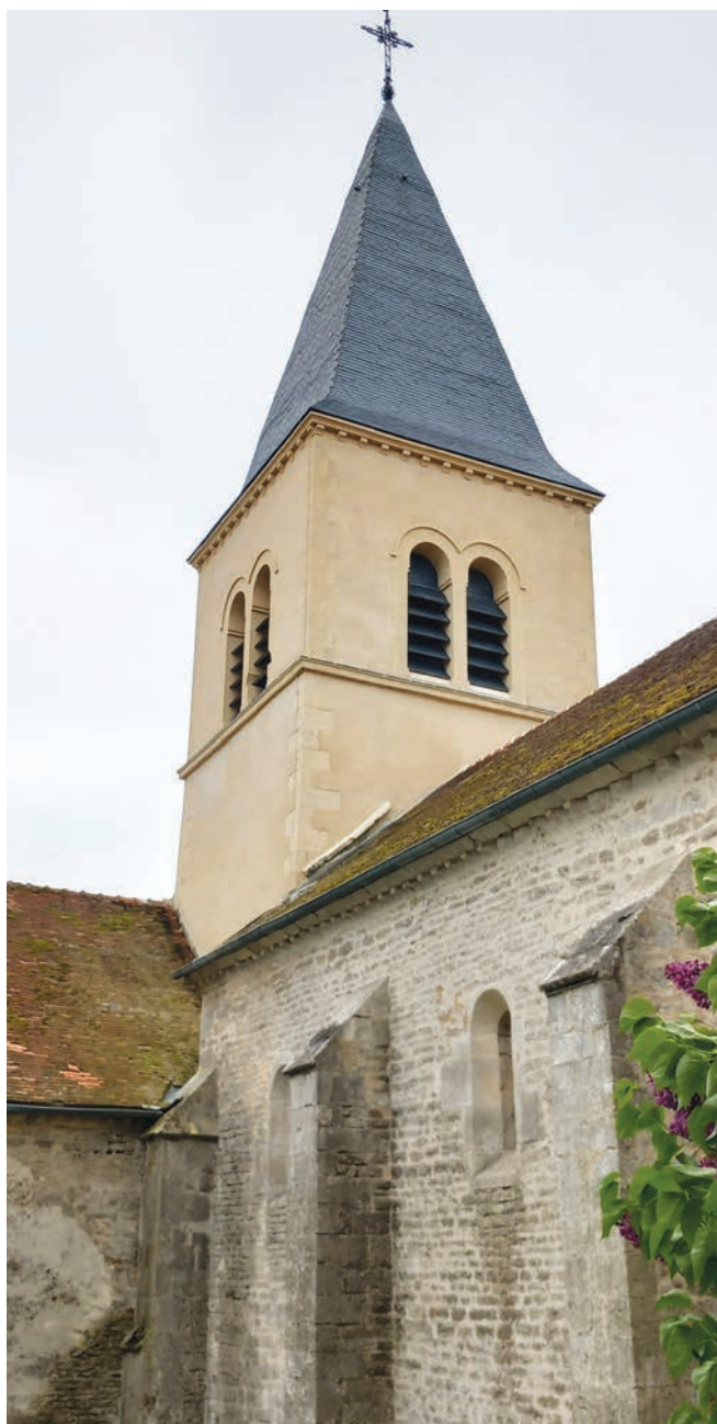
La 1 re phase a permis au clocher de faire peau neuve.

Cet apport financier salubre s'ajoute à celui des partenaires institutionnels (DRAC, Département, Région BFC et Sauvegarde de