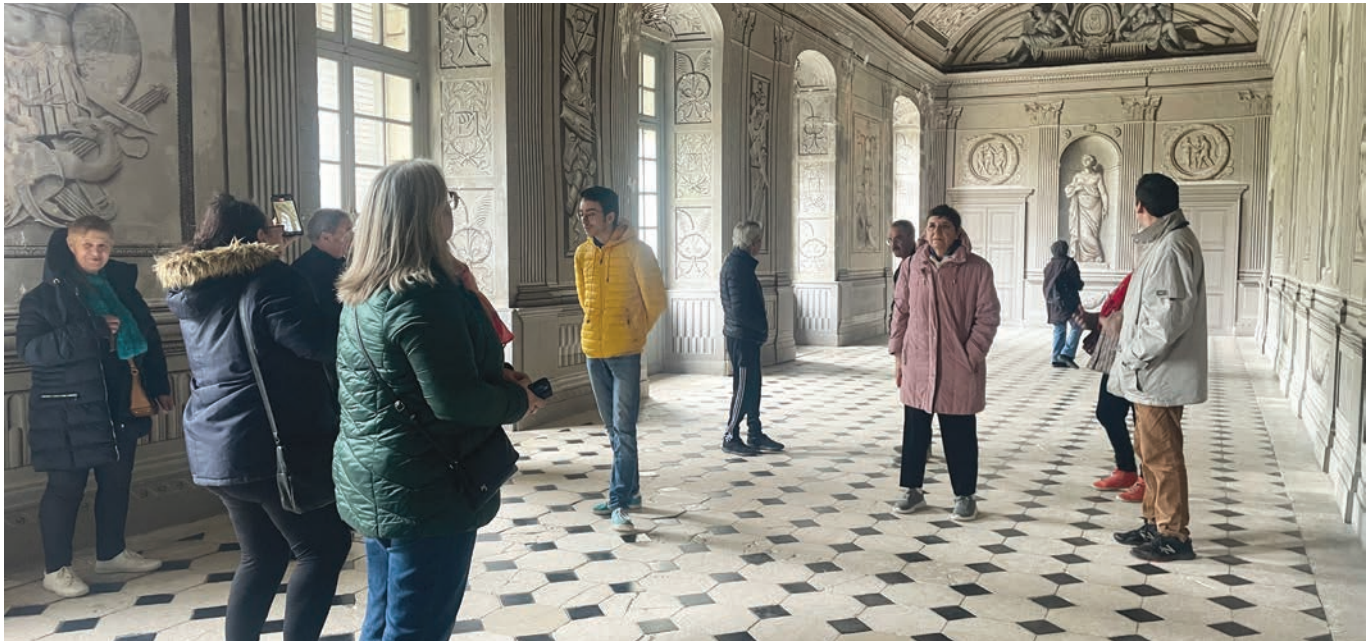
Pendant la visite.

Une sortie a été organisée par le Centre socio-culturel et de Loisirs du Pays Châtillonnais au château de Tanlay dans l'Yonne. Les participants ont eu accès à différentes pièces du château.