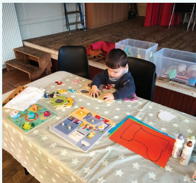
Un enfant attentif.

Une fois par mois, le Relais Petite Enfance du Pays Châtillonnais se délocalise dans les bassins de vie de la communauté de communes. Des temps d'animation collectifs à destination des assistantes maternelles et des enfants ont été proposés sur les communes de Laignes, Brion-sur-Ource, Saint-Broing-Les-Moines. D'autres sont prévus à Bellenod-sur-seine mais également à Coulmier-le-Sec dans les mois à venir. Ces temps permettent aux assistantes maternelles de rompre l'isolement auquel elles peuvent parfois être confrontées en tant que professionnelles exerçant à domicile. Les enfants, quant à eux, profitent d'activités motrices, sensorielles et de jeux en groupe. Le RPE accompagne également les parents dans la recherche d'un mode de garde et dans les démarches administratives pour les contrats de travail.