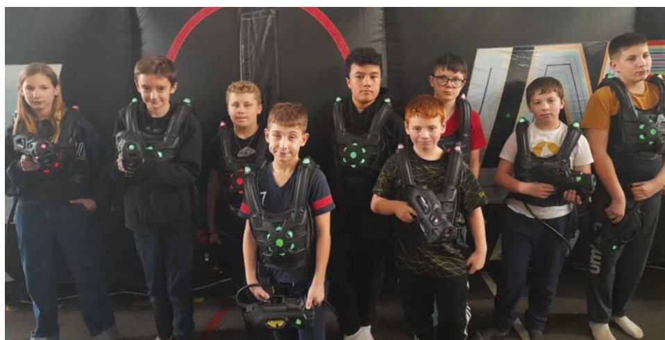
80 joueurs ont participé à cette journée à Laignes.

mense salle gonflable, et dans le noir total.