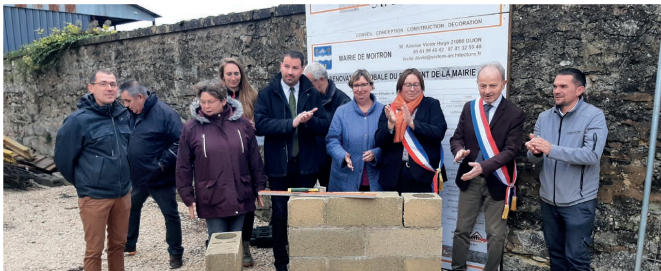
Pose de la première pierre de la restauration.

Ce bâtiment situé au centre du village a été construit dans les années 1880 afin d'accueillir une nouvelle école avec une mairie et un logement pour l'instituteur. À la fermeture de l'école en 1981, la salle de classe devient alors la salle polyvalente du village. Vieillissant, le bâtiment ne répond plus aux dernières normes en vigueur notamment en matière d'accessibilité pour les personnes à mobilité réduite mais également aux critères thermiques et électriques.