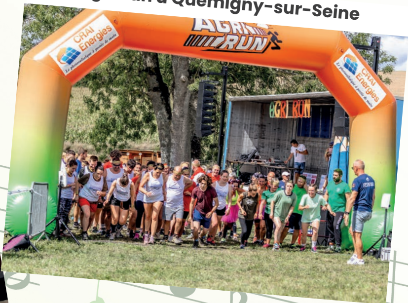
Agri Run à Quemigny-sur-Seine