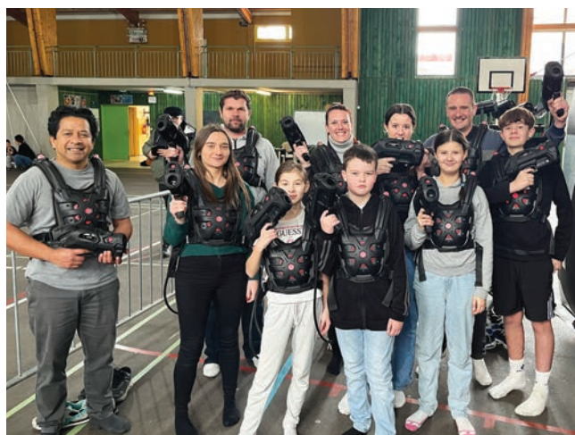
... au laser game.

À l'occasion des vacances scolaires de février, la commune de Laignes a été le théâtre d'une folle journée de lasergame !