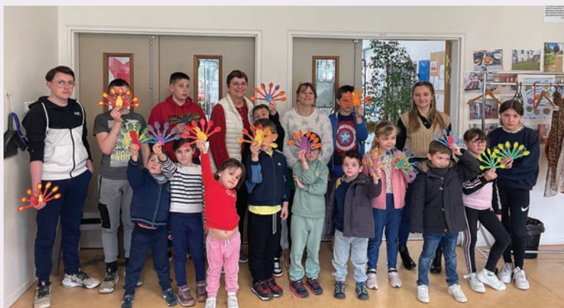
Les enfants et leurs œuvres.