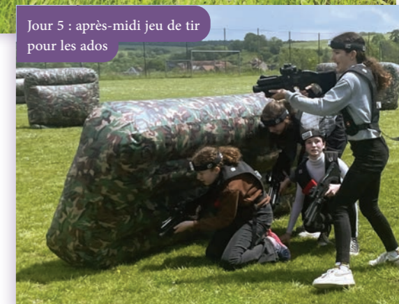
Jour 5 : après-midi jeu de tir pour les ados

Programme chargé le mercredi 22 mai : promenade à dos d'âne le matin pour les familles, avec Le Petit Bonheur 21 à Saint-Germain-le-Rocheux, suivie d'une après-midi en extérieur à Jeu 2 Tir de Buncey (délocalisé à Aignay-le-Duc pour l'occasion) pour les adolescents.