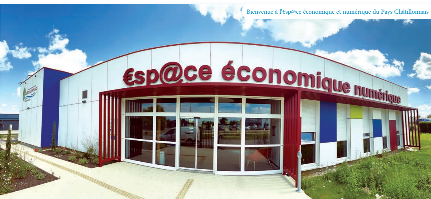
Bienvenue à l'Esp@ce économique et numérique du Pays Châtillonnais

Créer un espace où chacun peut s'intégrer en fonction de ses activités et projets professionnels à des tarifs attractifs, voici l'ambition des élus de la Communauté de Communes du Pays Châtillonnais.