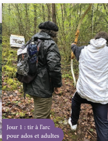
Jour 1 : tir à l'arc pour ados et adultes