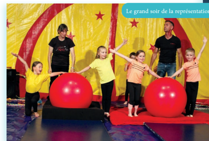
Le grand soir de la représentation

La semaine suivante, c'est l'eau qui était à l'honneur, avec par exemple la construction de radeaux et une sortie à la piscine de Châtillon-sur-Seine, avant de laisser place à un tour de France et aux Jeux Olympiques les deux dernières semaines.