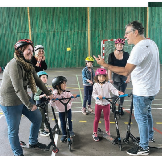
Jour 2 : sports de glisse (rollers et trottinette) pour enfants et leurs parents