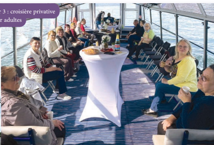
Jour 3 : croisière privative pour adultes