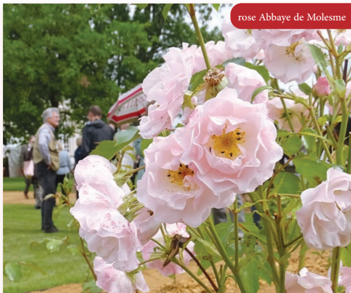
rose Abbaye de Molesme