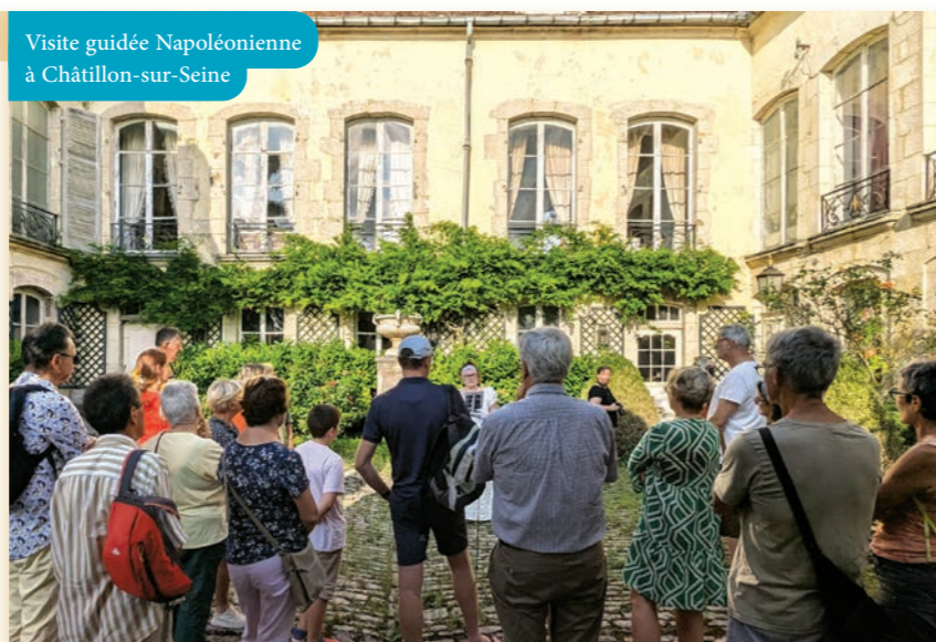
Visite guidée Napoléonienne à Châtillon-sur-Seine

La nouvelle visite guidée autour de l'époque Napoléonienne, notamment, a accueilli plus d'une cinquantaine de curieux sur quatre dates !