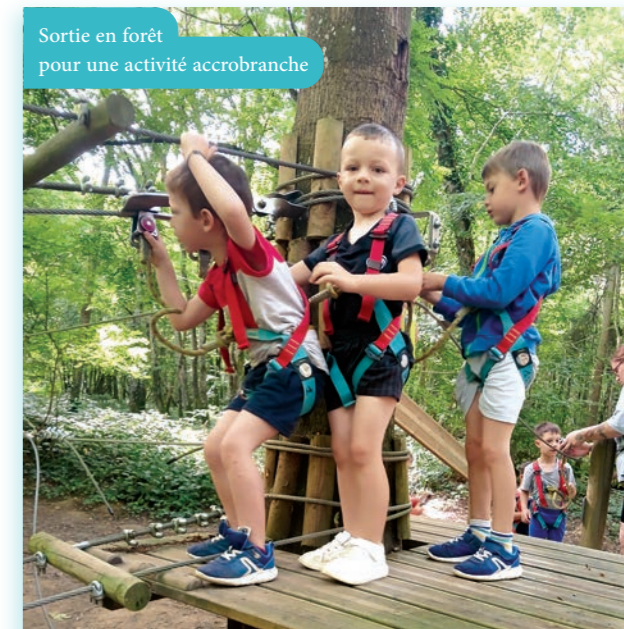
Sortie en forêt pour une activité accrobranche