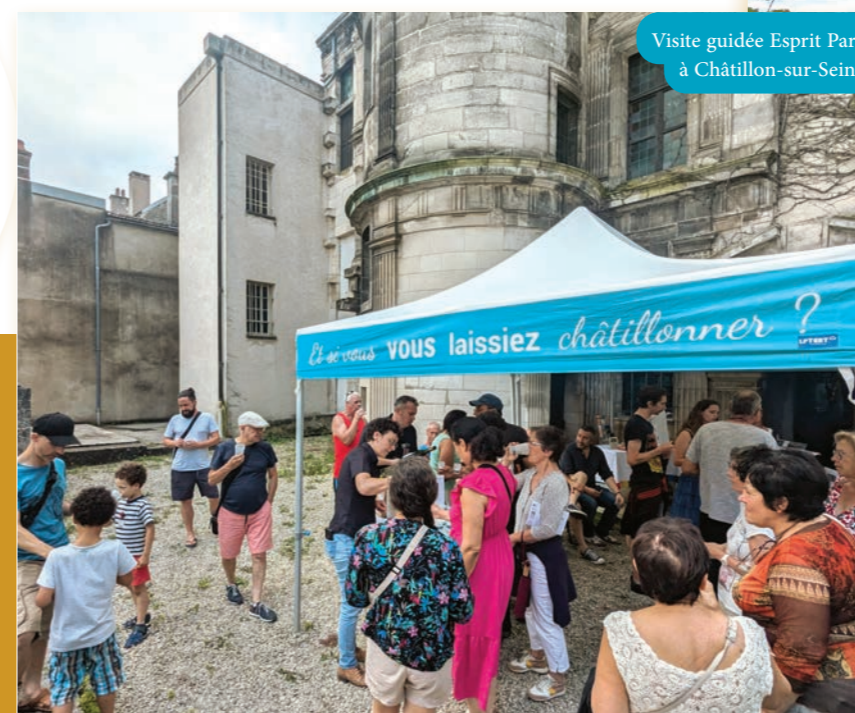
Visite guidée Esprit Parc à Châtillon-sur-Seine

Enfin, quatre-vingt-dix habitants et vacanciers se sont laissés tenter par une visite guidée labellisée Esprit Parc national, souvent ponctuée de démonstrations et/ou dégustations de prestations « marquées ». Les Ruchers de Darbois, l'Atelier de la Faine et L.M. Chardon ont grandement contribué au succès de ces visites.