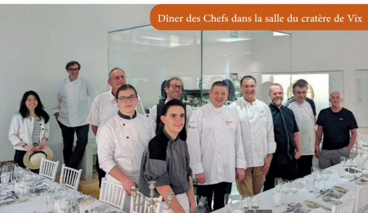
Dîner des Chefs dans la salle du cratère de Vix

Vendredi 21 juin a eu lieu la huitième édition du Dîner des Chefs. Après l'Abbaye de Fontenay ou encore le MuséoParc Alésia, c'est dans le musée du Pays Châtillonnais – Trésor de Vix, que cet événement a été organisé par le Club des Hôteliers Restaurateurs de Haute Bourgogne, grâce à la présence de six chefs gastronomiques renommés de la région.