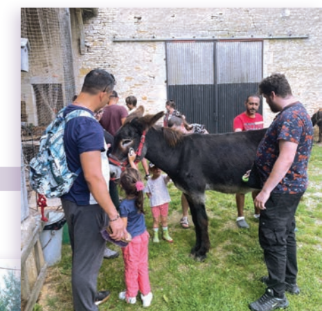
Sortie matinale avec les ânes

Par un exceptionnel beau temps, au vu de la météo que ce mois de juillet nous a réservé, les inscrits ont parcouru les bois accompagnés d'un guide forestier. Grâce à ses sens de l'observation et de la pédagogie, ce dernier a su captiver l'attention de chacun tout au long de la promenade, repérant ici les empreintes de pas d'un sanglier, là le lieu de repos d'un chevreuil, les excréments d'un putois marquant son territoire, les signes de sécheresse dans les arbres, etc.