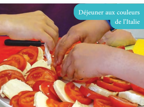
Déjeuner aux couleurs de l'Italie

Après l'effort venant le réconfort, la semaine suivante a fait la part belle aux cultures et aux spécialités culinaires des cinq continents : si le matin était consacré à la fabrication de masques africains, d'attrape-rêves, de chapeaux d'Arlequin ou de lampions chinois, l'après-midi promettait de faire voyager les papilles à l'heure du goûter.