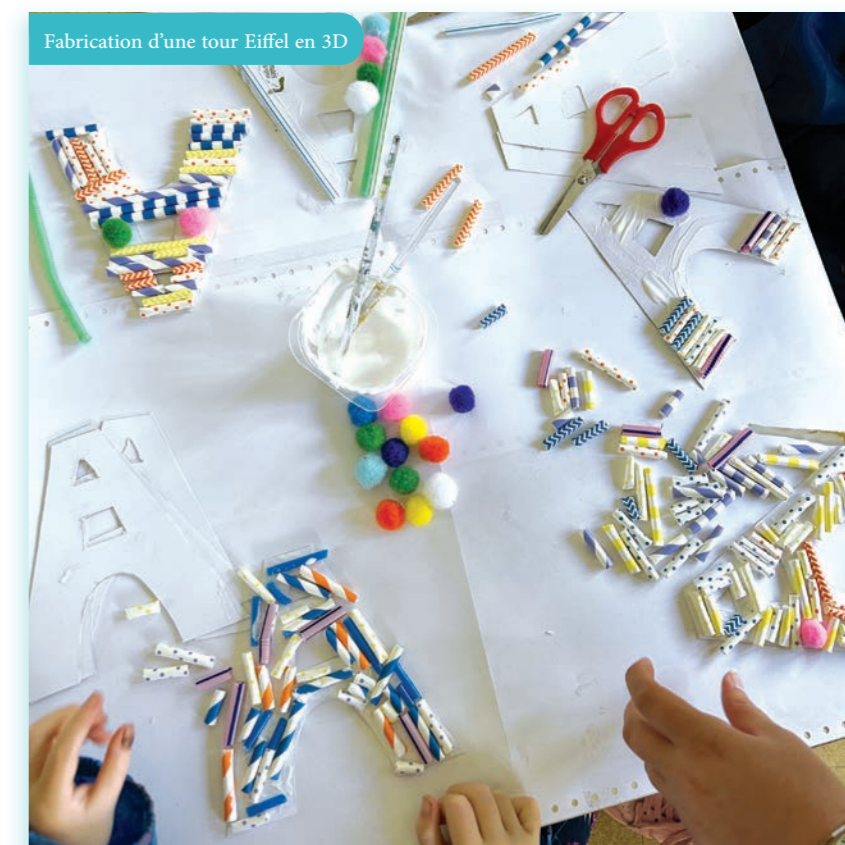
Fabrication d'une tour Eiffel en 3D