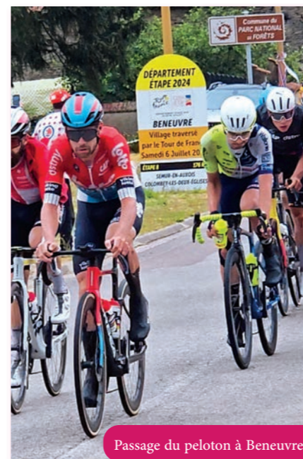
Passage du peloton à Beneuvre