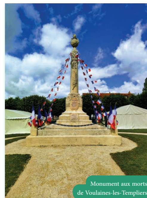
Monument aux morts de Voulaines-les-Templiers

Voilà cent ans, à Voulaines-les-Templiers, fut érigé le monument aux morts en mémoire des combattants tombés au combat lors de la Première Guerre mondiale. En 2024, à l'occasion du centenaire, le maire a souhaité leur rendre un hommage spécial.