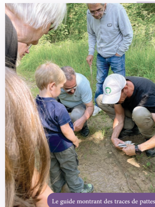
Le guide montrant des traces de pattes