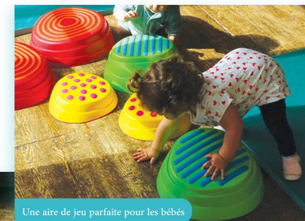
Une aire de jeu parfaite pour les bébés