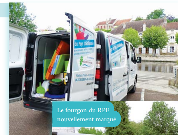
Le fourgon du RPE nouvellement marqué

Le RPE part ainsi à la rencontre des assistantes maternelles tous les mois ; or, pour transporter le matériel nécessaire (modules de motricité, caisses de jeux, etc.), le RPE du Pays Châtillonnais a fait l'acquisition d'un utilitaire : celui-ci est désormais marqué, pour que le RPE s'affiche même en itinérance !