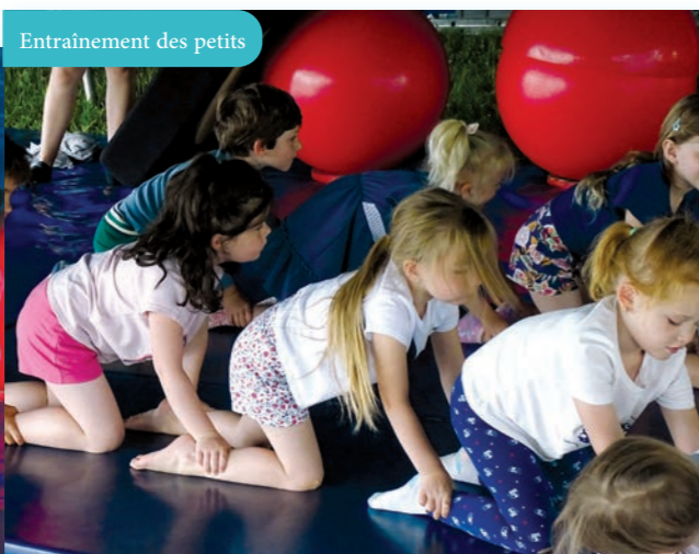
Entraînement des petits

Moment déterminant pour le reste de la semaine : le lundi, chaque enfant a choisi une spécialité entre jonglage, trapèze, clown et équilibre, qu'ils ont alors exercée au fil des jours et à partir desquelles ils ont conçu divers numéros.