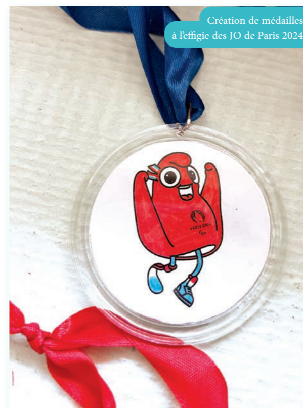
Création de médailles à l'effigie des JO de Paris 2024