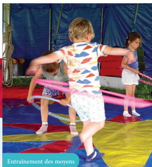
Entraînement des moyens

« Je n'avais qu'un contact, qui ne convenait pas à mes attentes. Mais un jour, j'ai découvert le cirque Réno en passant à Bar-sur-Seine. »