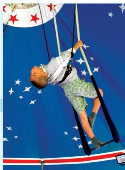
Entraînement des grands