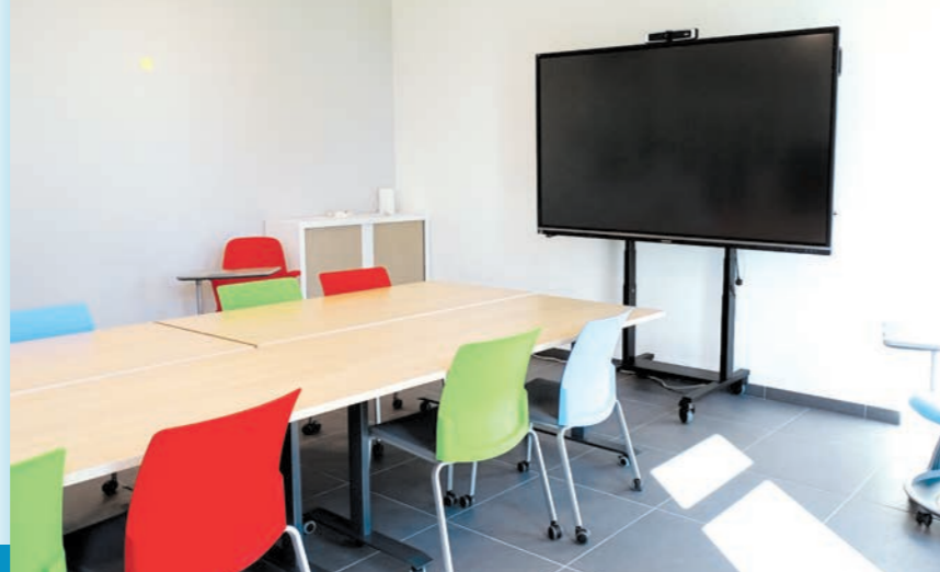
Salle de réunion de l'espace économique

Retrouvez les informations pratiques et les tarifs sur le site de la Communauté de Communes du Pays Châtillonnais : chatillonnais.fr .