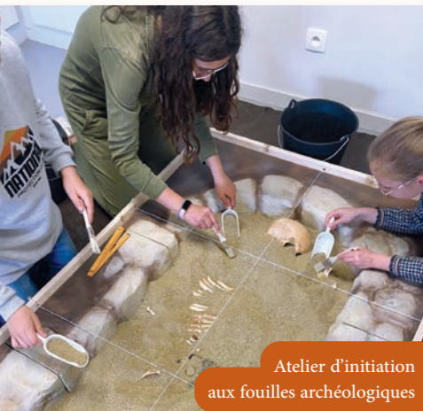
Atelier d'initiation aux fouilles archéologiques

Pour cette édition 2024 des Journées Européennes de l'Archéologie (JEA), le musée du Pays Châtillonnais – Trésor de Vix accueillait 338 visiteurs, venus découvrir gratuitement les collections du musée entre le 14 et le 16 juin.