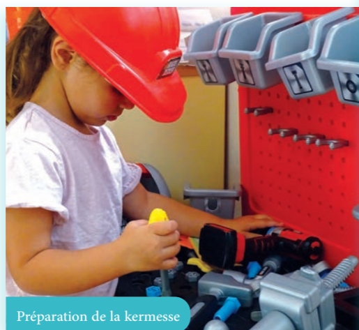
Préparation de la kermesse

La troisième semaine, la thématique « Défis en pagaille » a mis l'adresse et l'imagination des petits comme des grands à l'épreuve. Puis c'est l'esprit de fête qui s'est emparé de tous pendant la dernière semaine, avec la préparation d'une kermesse destinée à toutes les familles !