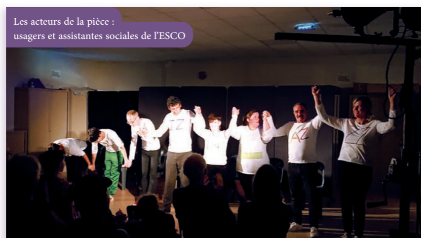
Les acteurs de la pièce : usagers et assistantes sociales de l'ESCO