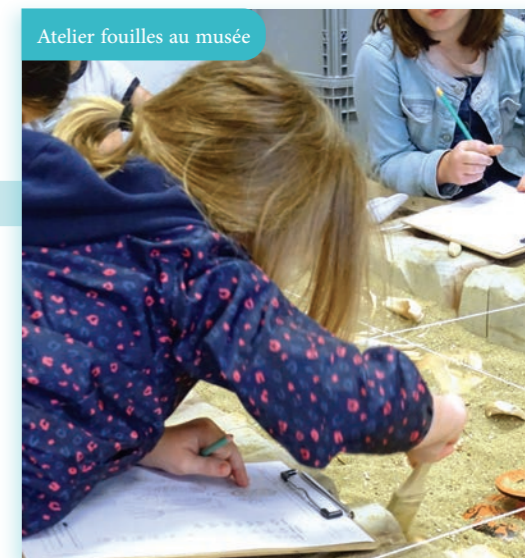
Atelier fouilles au musée

En première semaine, préparation du terrain : on fabrique son passeport, on installe les panneaux et on fait un saut dans le passé grâce à un atelier de fouilles archéologiques au Musée du Pays Châtillonnais – Trésor de Vix. La deuxième semaine, direction les steppes amérindiennes pour y rencontrer les cow-boys ! Puis c'est en Inde que nous emmène la troisième semaine de découverte des cultures étrangères, avec une escale aux « olympi-tropiques », lancement des JO de Paris 2024 oblige. Enfin, notre tour du monde s'achève en Extrême-Orient, au thème focalisé sur notre rapport à la nature, notamment par un parcours accrobranche qui clôture ces vacances hors du temps.