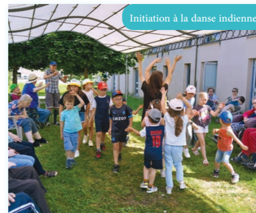
Initiation à la danse indienne