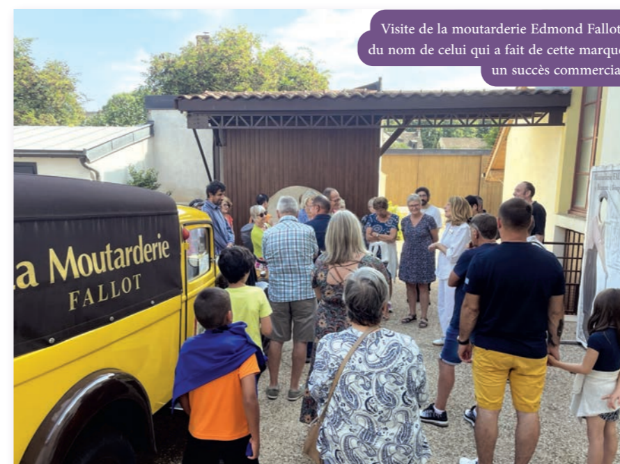
Visite de la moutarderie Edmond FalLOT, du nom de celui qui a fait de cette marque un succès commercial

Jeudi 7 août, la chaleur, le soleil et les Châtillonnais étaient en force à Beaune ; malgré un réveil aux petites heures pour un départ à 8 h 15 et une arrivée à 11 h, les yeux lourds ont rapidement pu s'alléger grâce à la lumière reconfortante du soleil. Voilà le début d'une belle journée.