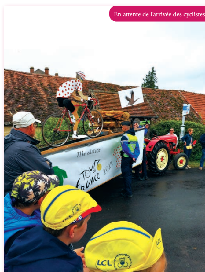
En attente de l'arrivée des cyclistes