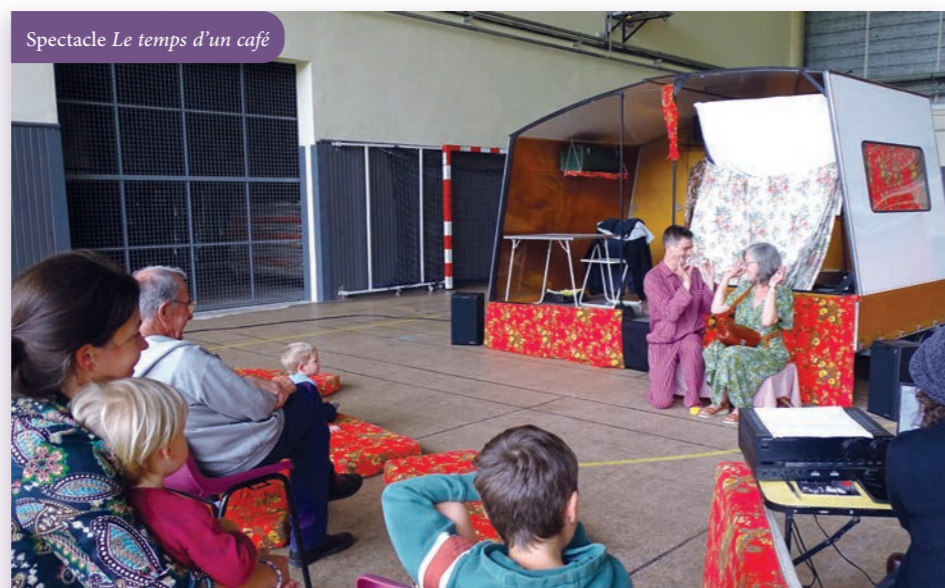
Spectacle Le temps d'un café

Un appartement / wagon de métro / bureau de travail sorti d'une remorque, le conte d'un rêve de voyage tout en mimes et en danse, une parenthèse d'émerveillement et de rires. Voilà ce qu'ont offert le CSCL et la compagnie Wanubida aux spectateurs présents à l'occasion de la pièce Le Temps d'un café dans la salle omnisport Désiré Vêque, le mercredi 3 juillet.