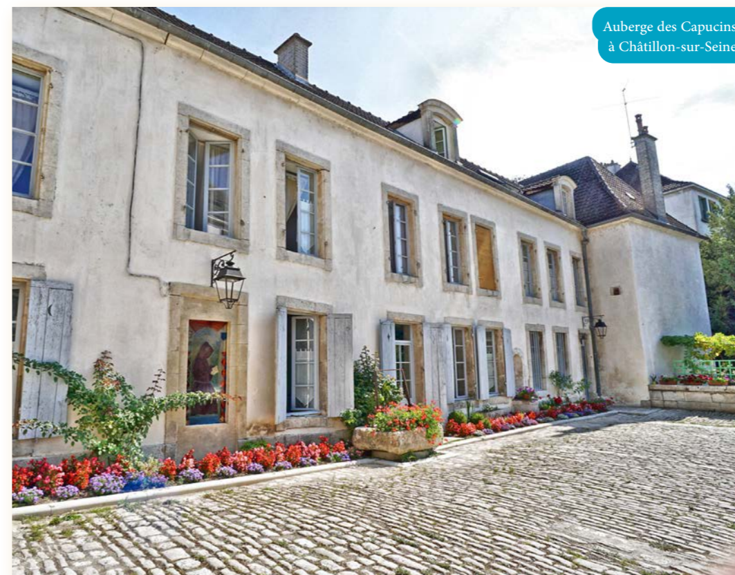
Auberge des Capucins à Châtillon-sur-Seine

Ce réseau, fort d'une reconnaissance nationale, permet à coup sûr d'organiser un voyage réussi en terres viticoles. En effet, le label est un gage de qualité : les critères de sélection demandés par Atout France, renforcés par l'exigeant audit des caves mis en place en 2021 par le Bureau Inter-professionnel des Vins de Bourgogne, assure une offre oenotouristique complète et de qualité. Grâce à des acteurs toujours aussi motivés et dynamiques, les labellisés du vignoble du Châtillonnais proposent une offre riche et variée à ses touristes : de la visite d'un musée à la découverte de caves en passant par la dégustation d'un savoureux repas, il y en a pour tous les goûts !