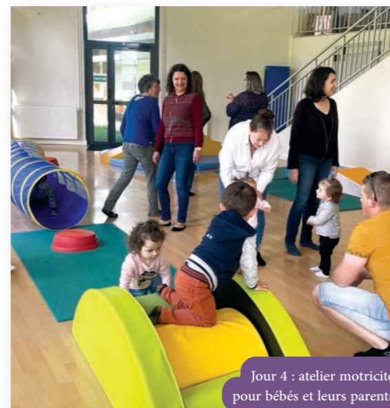
Jour 4 : atelier motricité pour bébés et leurs parents

Après le week-end de Pentecôte, redémarrage en douceur pour les bébés (0-3 ans) et leurs parents, avec un atelier de motricité au CSCL.