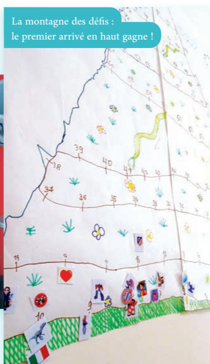
La montagne des défis : le premier arrivé en haut gagne !

Aux centres de loisirs de Recey-sur-Ource et Aignay-le-Duc