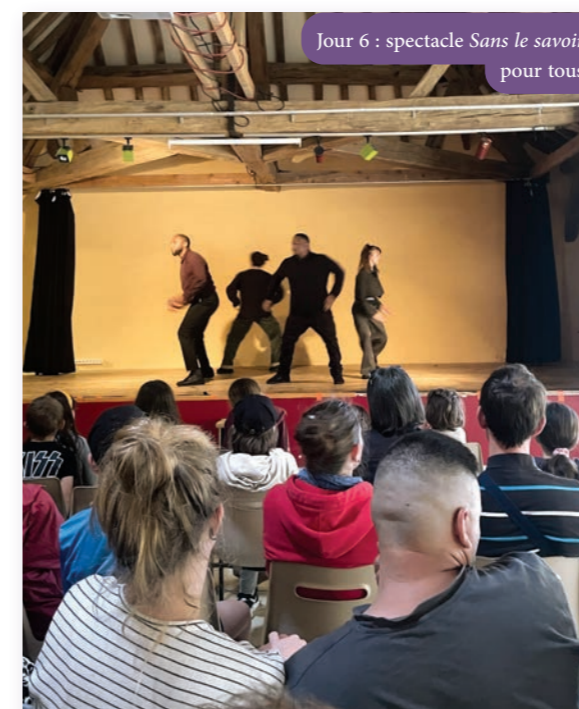
Jour 6 : spectacle Sans le savoir pour tous

Enfin, spectacle le samedi soir sur le thème « Comment les écrans agissent sur le quotidien des familles et influencent nos relations aux autres ». Nommé Sans le savoir de la compagnie et joué par la compagnie Z-tribulations, il a été compris même par les petits.