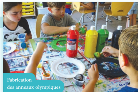
Fabrication des anneaux olympiques

C'est sous la thématique des Jeux Olympiques que le coup d'envoi des vacances à Sainte-Colombe-sur-Seine était donné, avec la conception des médailles, couronnes de laurier et fresques décoratives ayant servi aux olympiades organisées à la fin de la première semaine.