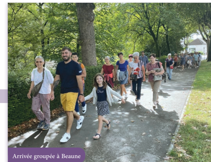
Arrivée groupée à Beaune

Chaque année, au mois d'août, le Centre Socioculturel et de Loisirs organise une journée de visites pour les Châtillonnais intéressés, afin de leur permettre de changer d'air, découvrir de nouveaux lieux, rencontrer de nouvelles personnes ou passer du temps avec celles qu'ils aiment. Cette année, c'est à Beaune que nos touristes se sont rendus.