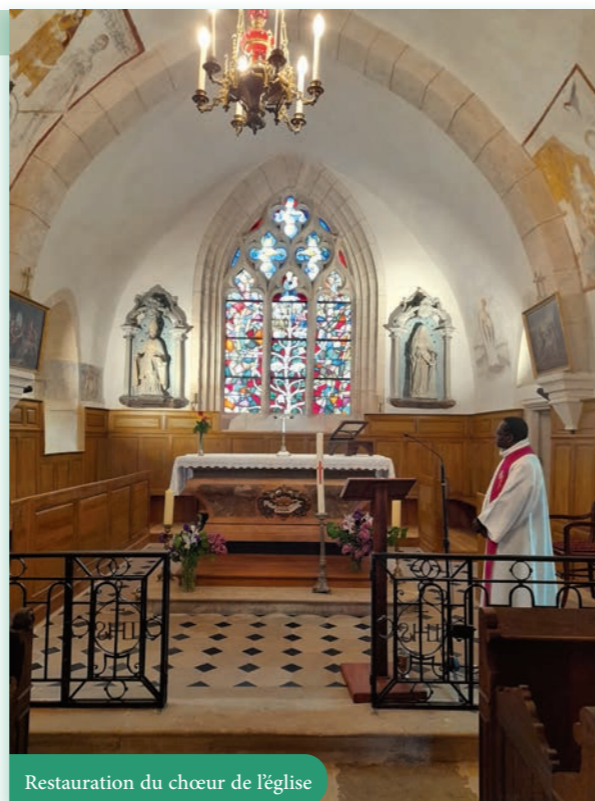
Restauration du chœur de l'église

Le projet de restauration a débuté en 1996 sous la mandature du maire Albert Viennot. La restauration extérieure a consisté en la réfection des charpentes et toitures de l'édifice qui a été fermé au public en 2011. Durant les travaux ont été mises à jour des fresques jusqu'alors inconnues, principalement dans le chœur. La 6 e et dernière tranche a débuté en novembre 2020 pour se terminer en mars 2024 avec la réinstallation du chemin de croix rénové.