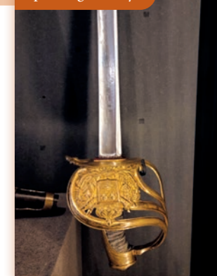
Épée de garde royal