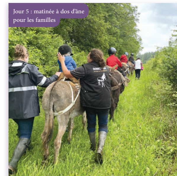
Jour 5 : matinée à dos d'âne pour les familles

Programme chargé le mercredi 22 mai : promenade à dos d'âne le matin pour les familles, avec Le Petit Bonheur 21 à Saint-Germain-le-Rocheux, suivie d'une après-midi en extérieur à Jeu 2 Tir de Buncey (délocalisé à Aignay-le-Duc pour l'occasion) pour les adolescents.