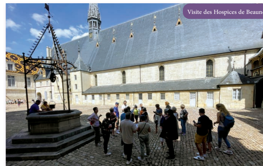
Visite des Hospices de Beaune

Mais il n'est pas encore temps de flâner, le groupe est attendu à la moutarderie FalLOT pour en visiter la fabrique. Sa moutarde de Bourgogne a obtenu en 2009 la certification IGP, illustrant les efforts de la maison familiale pour préserver une qualité et un savoir-faire qui ne sont pas pour rien dans le classement de la moutarde comme 3 e condiment préféré des Français.