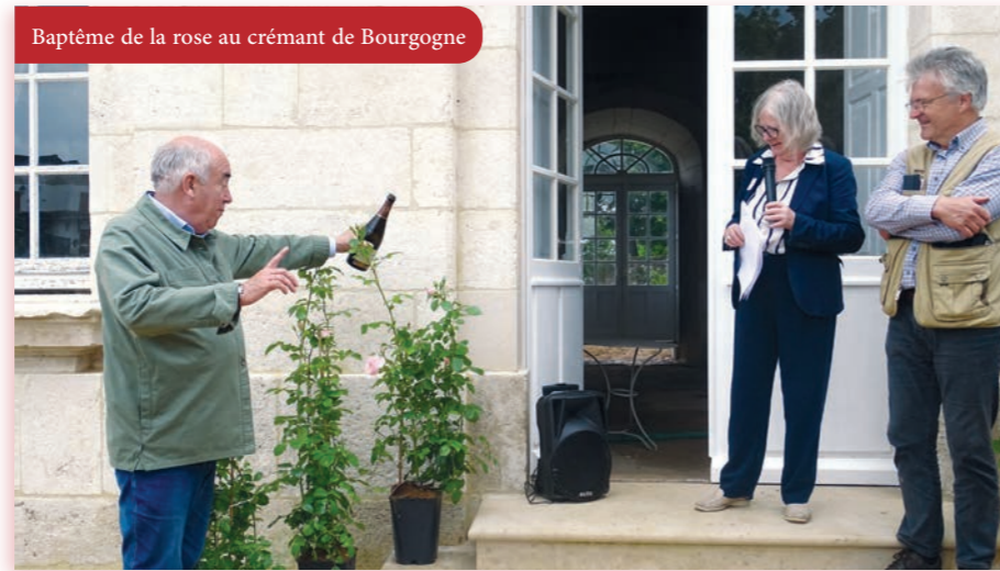
Baptême de la rose au crémant de Bourgogne

La restructuration des jardins liée à la réunification des parties du bâtiment en 2020 valait bien la création d'une rose, ornement courant de l'abbaye de Molesme avec les grappes de raisin. « Elle est rose pâle en référence à Notre-Dame, patronne de l'abbaye ; elle est buissonnante, car l'abbaye a essaimé dans tout le nord de l'Europe ; elle est remontante, car l'aventure de Molesme remonte à près de mille ans et elle est doucement odorante, car saint Robert est mort en odeur de sainteté. »