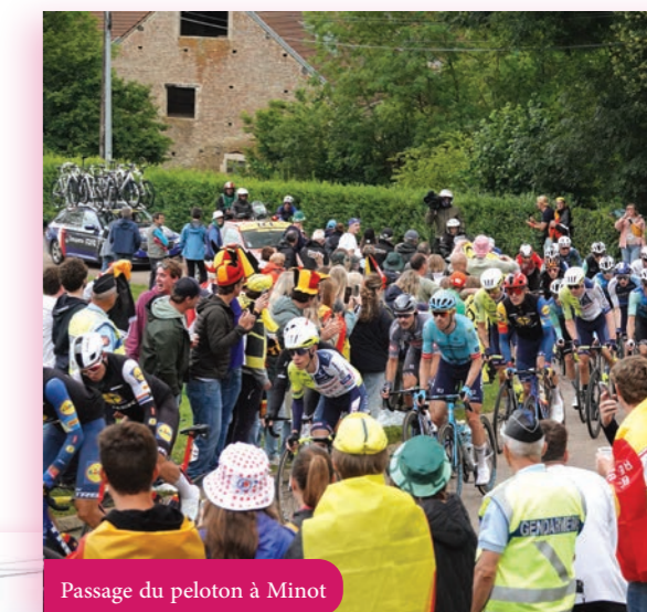
Passage du peloton à Minot