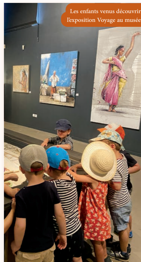
Les enfants venus découvrir l'exposition Voyage au musée

Le musée du Pays Châtillonnais – Trésor de Vix avait le plaisir d'accueillir jeudi 1 er août les enfants de la crèche La Capucine, venus à la rencontre des œuvres d'Emmanuel Michel.