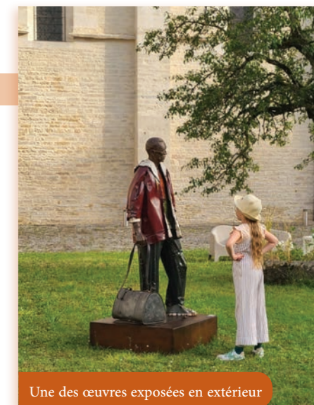
Une des œuvres exposées en extérieur